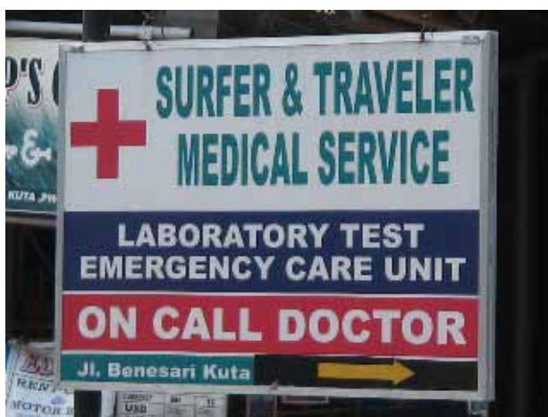
図5. on call clinic の一例

また、衛生面においてもまだまだ改善する余地がある。日本では一般化しているディスプレイの