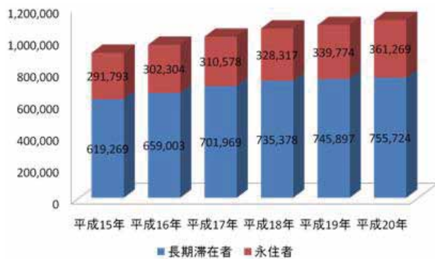
図1. 海外在留邦人数推移

団塊の世代が一気に定年をむかえる時代になり、彼らの年金による生活は日本国内において経済的に厳しいが、経済格差のあるアジアの国々で生活すれば優雅な暮らしができる。この経済格差に注目してテレビでも特集が組まれ、旅行業界においてもリタイア世代をターゲットにした長期滞在や永住を前提とした企画がみられる。それにともなって長期滞在者数が年々増加している(図1)。アジアの国々において、この世代を自国に迎え、外貨を獲得するためにリタイアメントビザを設定する国が増加している(表1)。このように海外での生活が身近になればなるほど、現地での生活環境が重要になる。特に高齢者が対象となるため医療の充実度は生活基盤の大きな要素になると思われる。今回、インドネシアのバリ島において歯科医療の実態を明らかにするために、在留邦人を対象に歯科保健活動を行っている