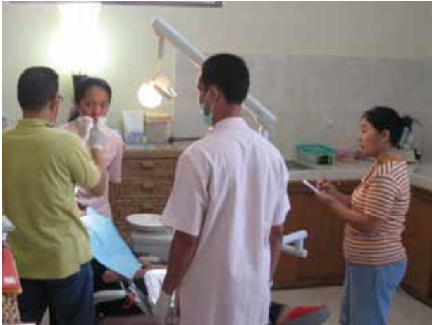
図4. 現地歯科医師への指導風景