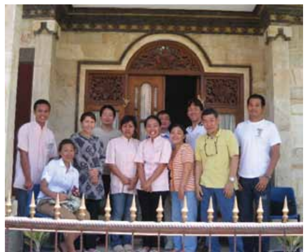
図3. アルジュナデンタルサヌール, 法人 (JDIA) メンバーと現地スタッフ

開設当時は現地駐在者、永住者そして観光客を中心に診療を行っていたが、その後、患者数の増加にともない場所をサヌールに移転したところ、ウブドに住むリタイアメント世代の患者が増加し現在に至っている。開設以来延べ患者数は600人を超え、現在は一般歯科以外に矯正歯科専門医や口腔外科専門医の指導のもと、インドネシア人歯科医師2名、現地スタッフ2名、日本人スタッフ2名の体制で診療を行っている (図3) (図4)。