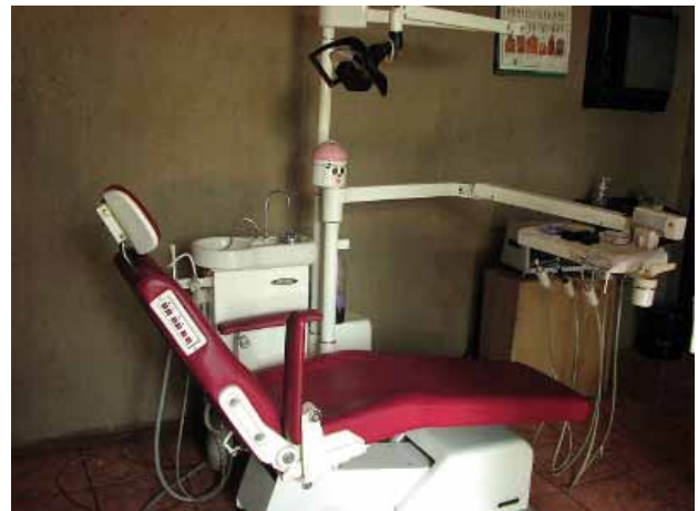
図6. バリ島の現地歯科医院の一例