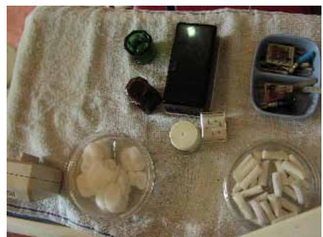
図7. バリ島の現地歯科医院の一例